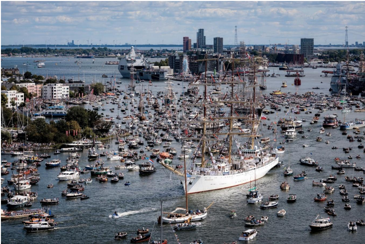
Afbeelding (door ANP): SAIL Amsterdam 2025 – eenieder die het zag, kon een glimp ervaren van de energie die in Nederland was ontketend in de Gouden Eeuw

Er is een significante mate van herconceptualisatie vereist van wat proper gezien de taken van de overheid behoren te zijn, als wij in Nederland ooit een terugkeer willen realiseren naar een propere vrije (laissez-faire) samenleving. Hier heb ik in andere stukken reeds uitgebreid over geschreven, met name in het boekje "Antibarbari 2022" en het essay "Filosofische Navigatie in de 21 e Eeuw" (beiden zijn op mijn website te lezen). Toch vergt het slechts een beperkt aantal economische wijzigingen om opnieuw een Gouden Eeuw in Nederland te ontketenen. Na eerst een aantal opmerkingen vooraf te plaatsen, zal ik dat in hoofdlijnen aan u voorrekenen.